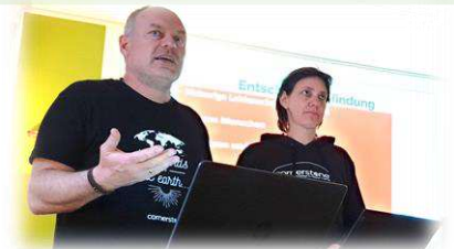
Gemeinsam im Reisedienst in Korntal